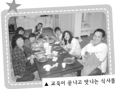
▲ 교육이 끝나고 맛있는 식사~