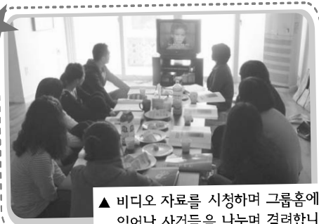
▲ 비디오 자료를 시청하며 그룹홈에서 일어난 사건들을 나누며 격려합니다.