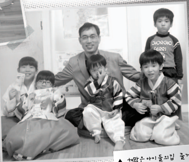
▲ 해맑은아이들의집 즐거운 추석