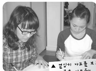
▲ 열심히 자료를 보고 있는 그룹홈 이모들~