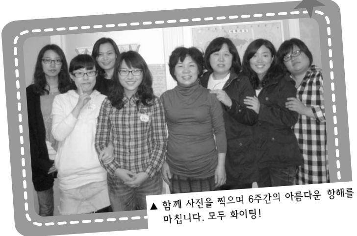
▲ 함께 사진을 찍으며 6주간의 아름다운 향해를 마칩니다. 모두 화이팅!