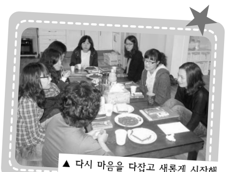
▲ 다시 마음을 다잡고 새롭게 시작해 보겠다는 우리 선생님들!