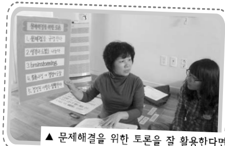
▲ 문제해결을 위한 토론을 잘 활용한다면 집안에서 벌어지는 다양한 문제들을 해결 하는데 실제적인 도움이 되겠지요.