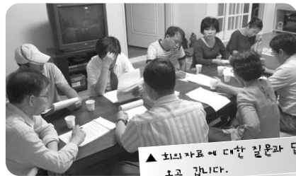
▲ 회의자료에 대한 질문과 답변이 노고 갑니다.