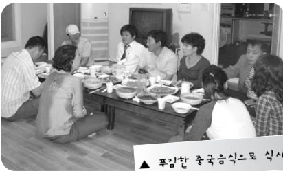
▲ 풍성한 중국음식으로 식사 먼저!

9월 16일, 해맑은아이들의집에서 이사회를 개최했습니다. 해맑은아이들의집 운영위원들도 함께 해 대안가정운동본부와 해맑은아이들의집 전반에 대한 이해를 높일 수 있었습니다. 오랜만에 하는 이사회라 많이 참석해주셔서 감사드리고, 이모들! 대청소하느라 힘들었죠? 고마워요~